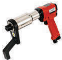
Пневмотические моментные мультипликаторы