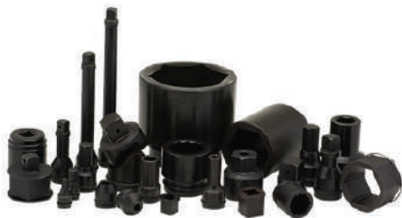
Ударные головки, удлинители и переходники (изготовление на заказ)