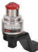
Ручные моментные мультипликаторы