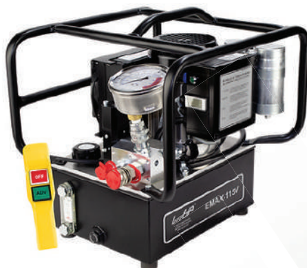
Гидравлическая маслостанция TorcUP серии EMAX