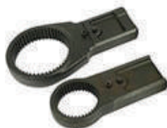
Аксессуары для реакции