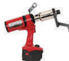
Электронные моментные мультипликаторы