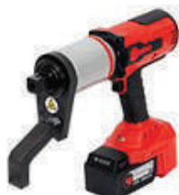
Аккумуляторные моментные мультипликаторы