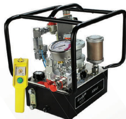
Гидравлическая маслостанция TorcUP серии AMAX