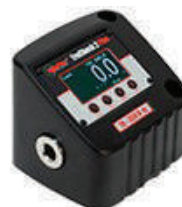
Изменение крутящего момента